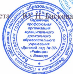
ГРАФИК Рабочего времени